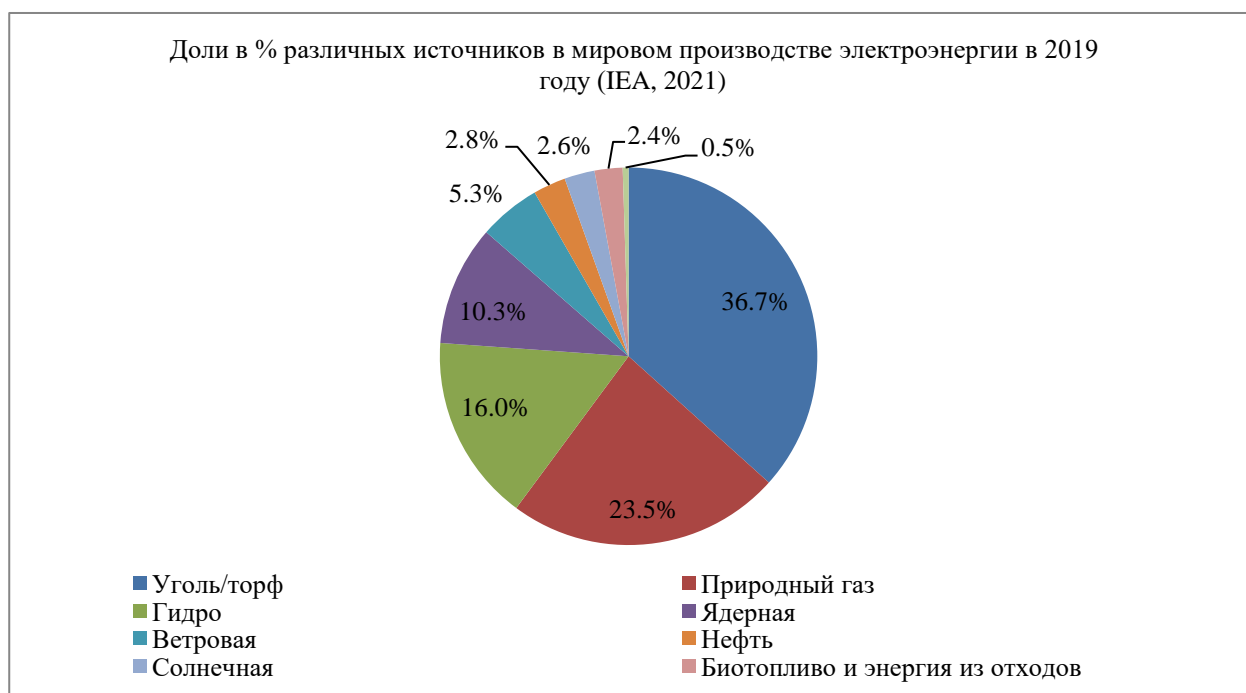
Рис. 2. Структура мировых источников электроэнергии Fig. 2. Structure of the world electricity sources