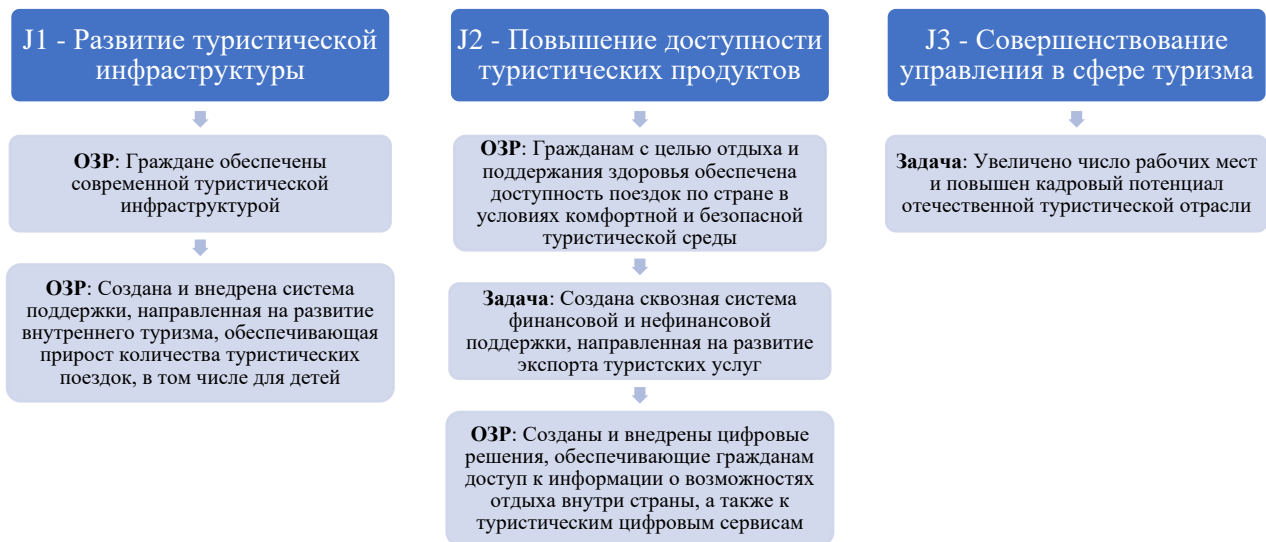
Рис. 3. Влияние ФП на решение задач НП «Туризм и индустрия гостеприимства»

В состав НП входят три федеральных проекта (далее ФП), каждый из которых направлен на решение задач и (или) достижение общественно значимого результата НП (рис. 3).