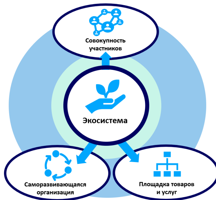
Рис. 1. Понятия «экосистема» с точки зрения экономической науки

Существует несколько основных определений термина «экосистема», рассматривающих одну модель с разных точек зрения.