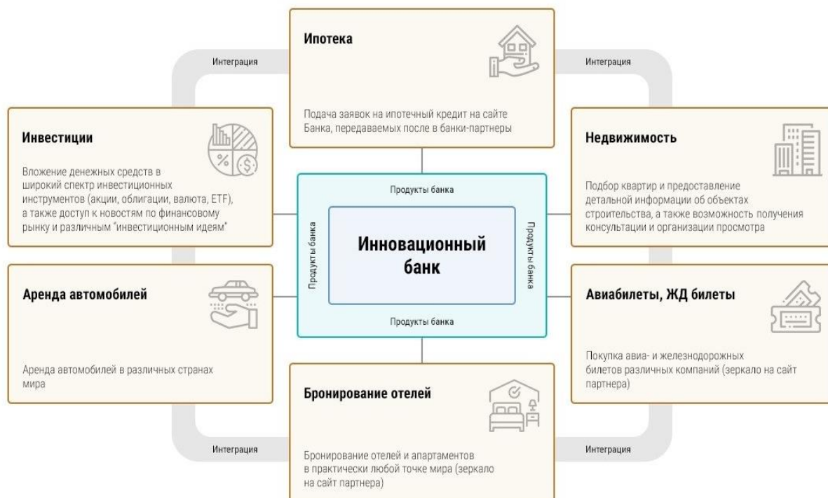
Рис. 3. Пример экосистемы банка Fig. 3. Example of an ecosystem of bank

большого количества самостоятельных участников сокращаются затраты на исследования. В связи с тем, что в экосистему включаются разноплановые бизнес-активности, растёт и креативная составляющая: появляются новые бизнес-идеи, кроме того, многие приходят уже со своими наработками. Всё это позволяет использовать «домашние заготовки» участников экосистемы для продвижения собственного бизнеса.