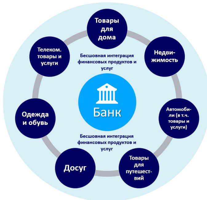
Рис. 2. Пример построения структуры экосистемы банка в розничном сегменте

При построении экосистемы необходимо понимать потребности и нужды целевого клиентского сегмента, которые представлены на рис. 2.