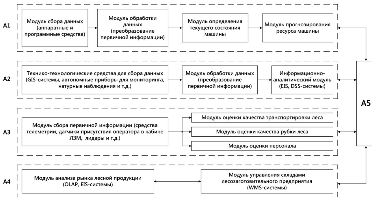
Рис. 1. Структура ИСУ лесозаготовками в рамках концепции «Индустрия 4.0» Fig. 1. Harvesting MIS structure within the frameworks of the «Industry 4.0» conception

В рамках предыдущей статьи информационная система управления (ИСУ) лесозаготовками в рамках концепции «Индустрия 4.0» была представлена в общем виде [Васенёв, 2019]. Далее представим её более подробную структуру (рис. 1).