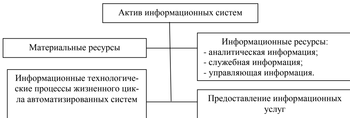
Рис. 3. Актив информационных систем Fig. 3. Activation of information systems

Основной целью обеспечения информационной безопасности следует выделить обеспечение защищенности информационных активов (рис. 3).