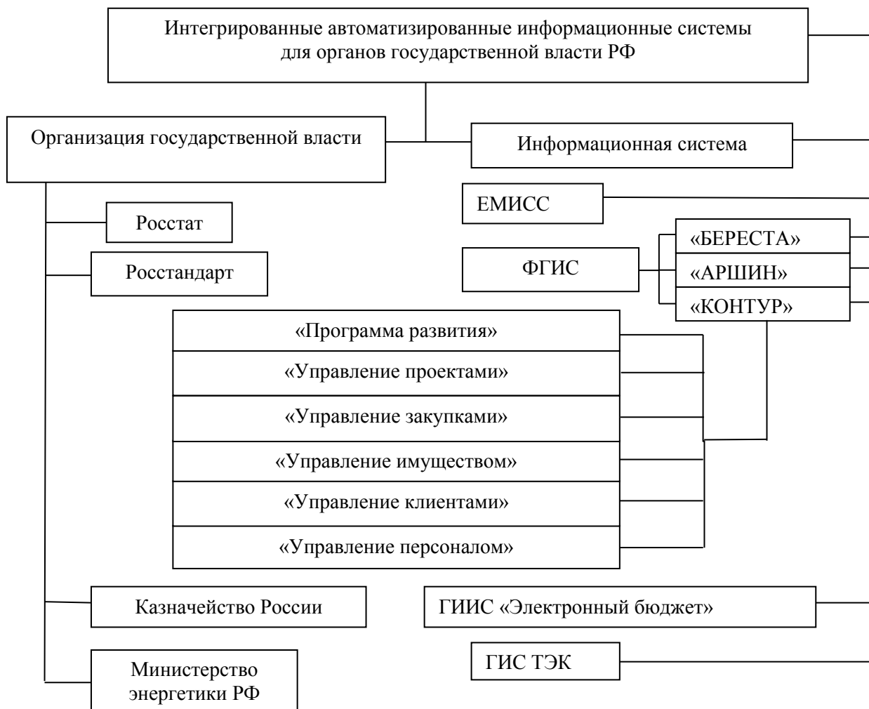
Рис. 1. Интегрированные автоматизированные информационные системы для органов государственной власти РФ

В наше время самым эффективным методом сбора, хранения и предоставления информации для органов государственной власти является использование интегрированных автоматизированных информационных систем. На рисунке 1 схематически представим некоторые информационные системы, которые находятся в распоряжении органов государственной власти. Данные информационные системы обладают широким масштабом ресурсов, хранящим в себе большое количество полезной информации, касающейся совершенно различных сфер деятельности. При создании всех информационных систем решалась одна общая задача – обеспечить доступ с помощью сети Интернет всем государственным, региональным и муниципальным органам власти, а также юридическим и физическим лицам к официальной статистической информации для повышения эффективности реализации и решения своих специфических задач.