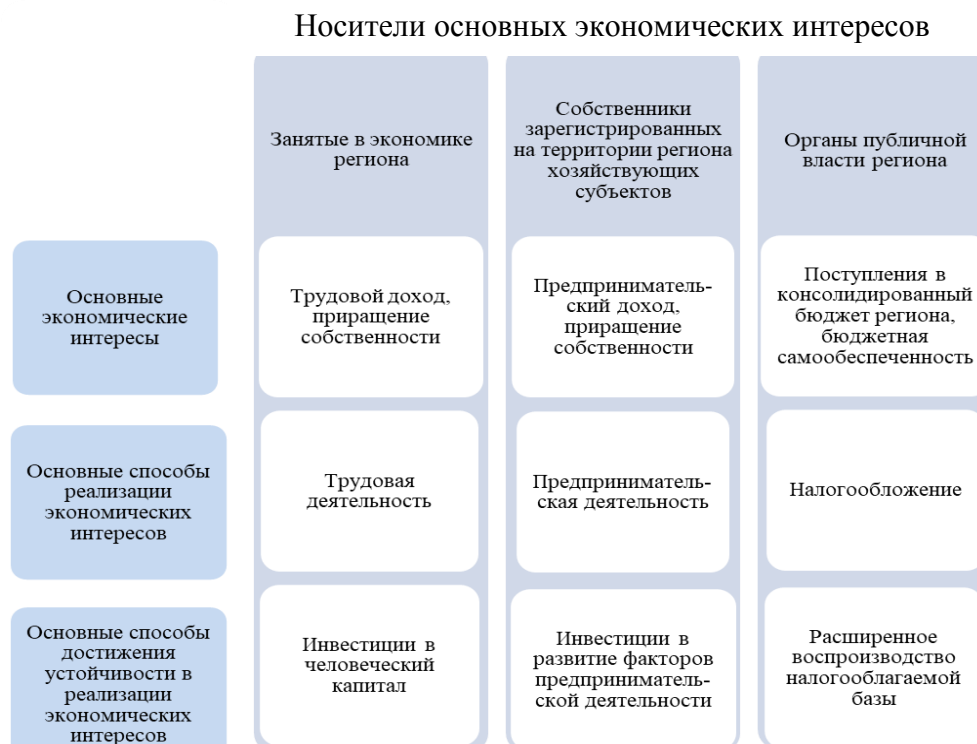
Рис 1. Экономические интересы и способы их достижения основными стейкхолдерами региона Fig. 1. Economic interests and ways to achieve them by the main stakeholders of the region

где БСП – бюджетная самостоятельность региона, %; ДБП – доля безвозмездных поступлений в бюджет региона, %.