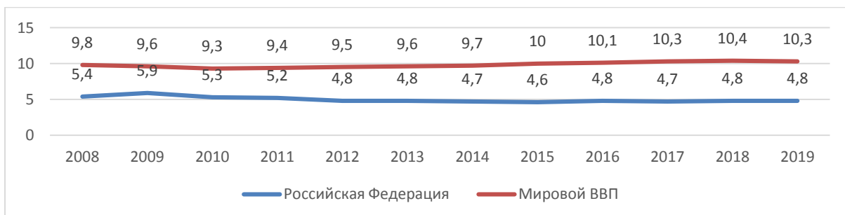
Рис. 1. Доля рынка туризма в мировом ВВП и ВВП РФ за 2008–2019 года, % [Кноета, 2020]

Развитие внутреннего рынка туризма до пандемии 2020. Согласно статистике, доля туризма в мировом ВВП составила 10,3 % в 2019 году, в свою очередь доля туризма в ВВП Российской Федерации – 4,8 % [Кноета, 2020] – см. рисунок 1.