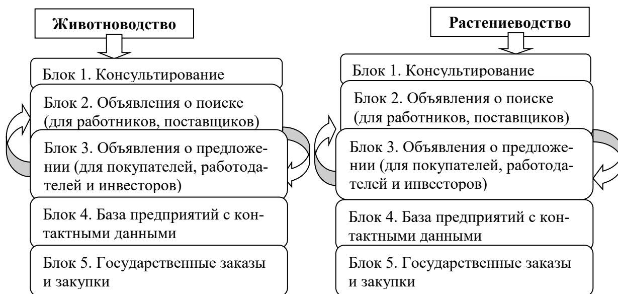
Рис. 1. Модель функционирования торговой площадки Fig. 1. The model of functioning of the trading platform

ИП, КФХ, организации и инвесторы получают полный доступ на площадку. Модель такого рода площадки должна включать несколько блоков (рис. 1). Общим для всех блоков считаем полезным введение функции закладки на Интернет-торговой площадке, чтобы пользователи могли всегда найти заинтересовавший их материал.