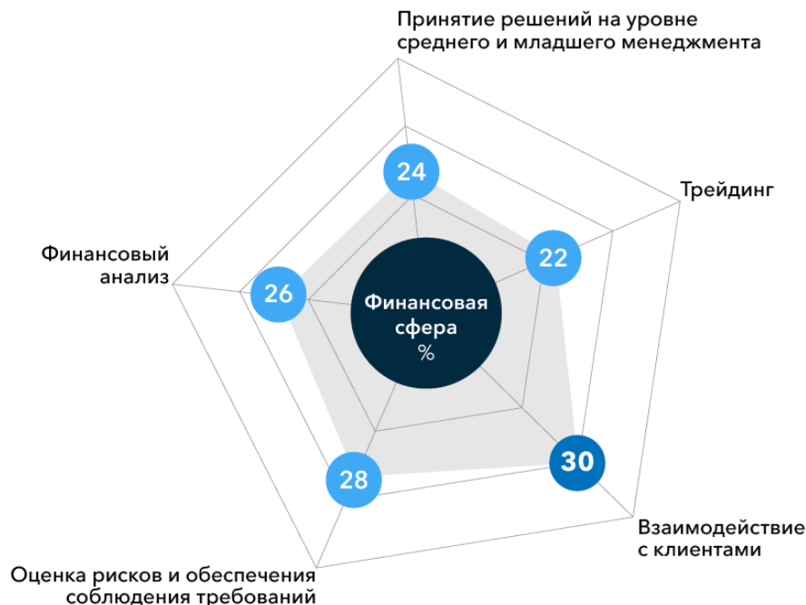
Рис. 1. Оценка влияния технологии ИИ в течении пяти лет в финансовой сфере (% респондентов)

Красноречиво выглядят перспективы использования ИИ в финансовой сфере (рис.1) на период ближайших пяти лет.