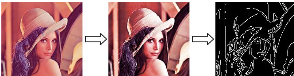
Рис. 3. Пример определения контуров с помощью алгоритма Кэнни Fig. 3. An example of determining the contours using the Canny algorithm

Главным недостатком метода Кэнни является невозможность задачи контуров при однородных цветах объектов или объектах с высокой градиентной составляющей.